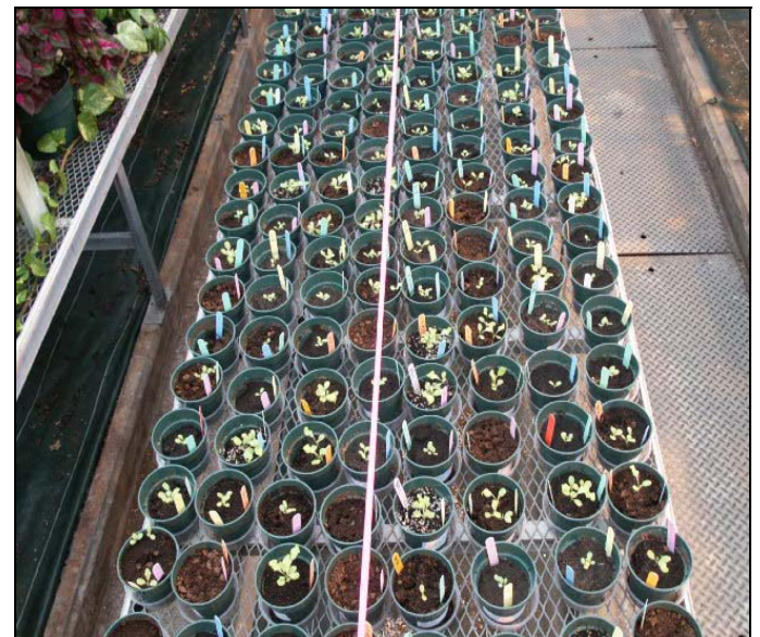
Figure 2 : Semis de tomates cultivés en conditions de serre

Nova Scotia Resource Recovery Fund Board Programme des chaires de recherche du Canada