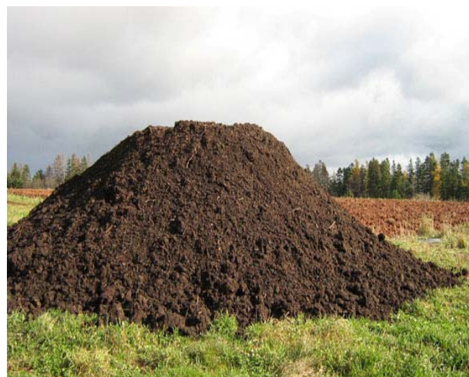
Figure 1 : Compost de la papeterie Clarendon

tourbe de bonne qualité pour un usage horticole, associé à la diminution de sa disponibilité dans un avenir proche en raison de contraintes environnementales, et particulièrement dans les pays sans ressources en tourbe, rend nécessaire la recherche de matières de substitution.