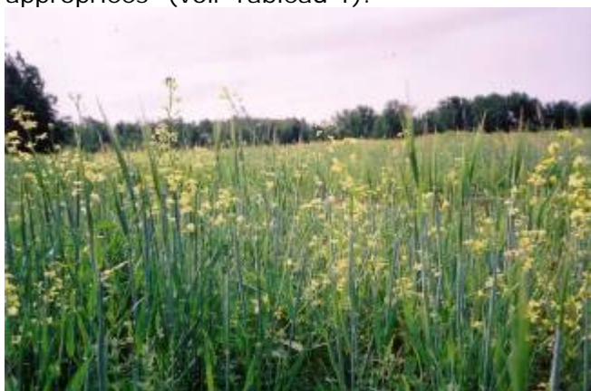
Floraison de radis sauvages dans un champ d'orge (K. Punnett)

Le radis sauvage peut réduire le rendement et la qualité des grains récoltés 1 . Des chercheurs ont découvert que 7 plants de RS/m 2 réduisaient le rendement du blé de 10 %. À une densité de 200 plants/m 2 , la réduction atteint 50 % 2 . Loin de produire une quantité limitée de graines, le RS en génère un grand nombre, aptes à survivre pendant des décennies dans le sol. Mieux vaut donc ne pas le laisser envahir un champ, car il sera difficile d'en combattre les graines. Pour maîtriser le RS, on recommande aux fermiers biologiques d'adopter une approche combinant des stratégies comme les rotations de cultures, des systèmes de prévention et des méthodes de travail du sol et de plantation appropriées 3 (voir Tableau 1).