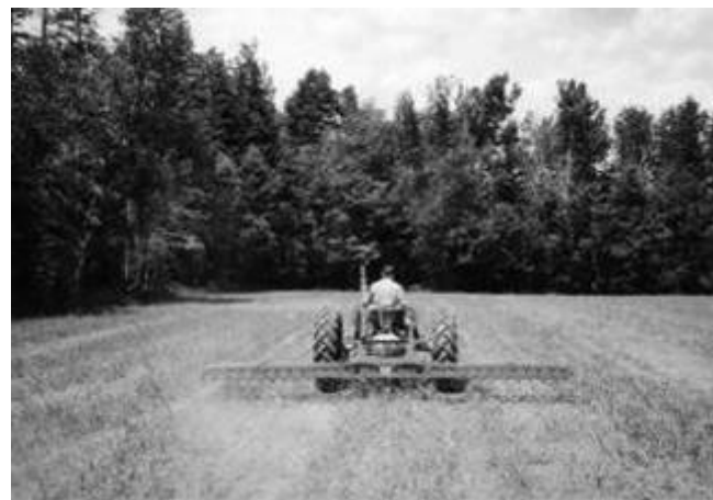
Hersage-binage post-émergence dans la lutte aux adventices (K. Punnett)

Dans l'ensemble, une combinaison de traitements BOMP et un taux élevé de semis s'est avérée la meilleure façon de diminuer la densité et la biomasse du RS. Bien que nous ayons observé des changements sur le plan de la concurrence des MH, ni les taux plus élevés de semis, ni les méthodes BOMP n'ont augmenté le rendement de la culture. Cependant, une gestion efficace du RS réduira le nombre de graines produites et diminuera les problèmes potentiels des années subséquentes. Nos méthodes BOMP n'ont pas été efficaces contre toutes les autres adventices. Le chiendent est très différent du radis sauvage, et ce n'est donc pas surprenant. L'efficacité des méthodes BOMP recensées dans la présente recherche pour lutter contre d'autres adventices doit être étudiée plus en profondeur.